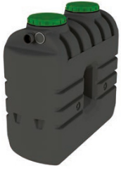
EPURBLOC 77 1500