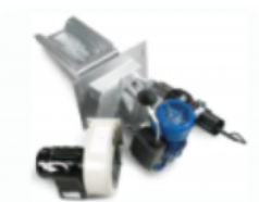
Queimador Osaka Plus [Acendimento Automático]