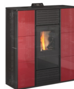
ROUGE (Panneau en Acier) REF. 0603.0103