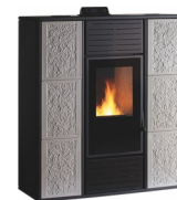
BLANC (Panneau en Céramique) REF. 0603.0122