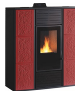
ROUGE (Panneau en Céramique) REF. 0603.0121