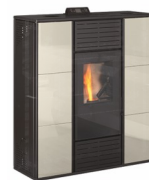
BEIGE (Panneau en Acier) REF. 0603.0104