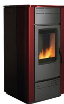
Vermelho (Painel em Aço)