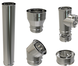
Módulo 1 Metro