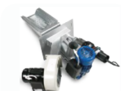
Queimador Osaka Plus (Acendimento Automático)