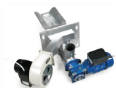
Queimador Osaka (Acendimento Manual)