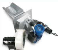
Queimador Osaka Plus [Acendimento Automático]