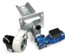
Queimador Osaka [Acendimento Manual]