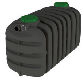
EPURBLOC 119 3000