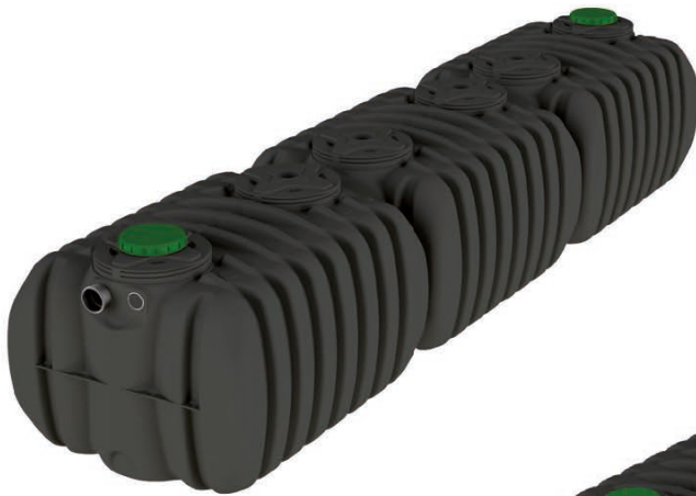
EPURBLOC 185 15000