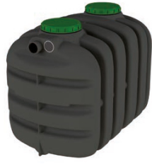
EPURBLOC 119 2000