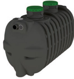
EPURBLOC 122 3000 Com realces REHC 400