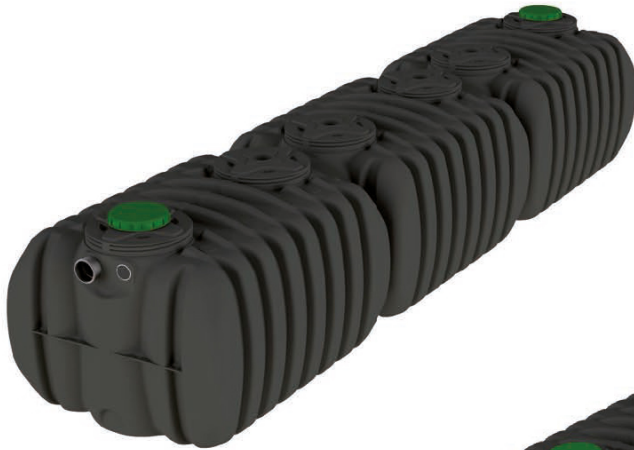
EPURBLOC 185 15000