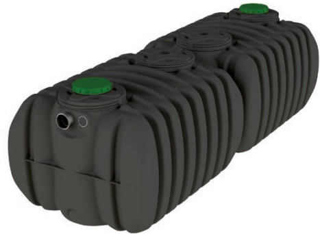
EPURBLOC 185 10000