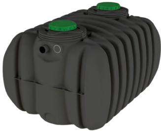
EPURBLOC 185 5000