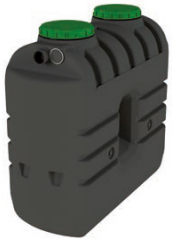
EPURBLOC 77 1500