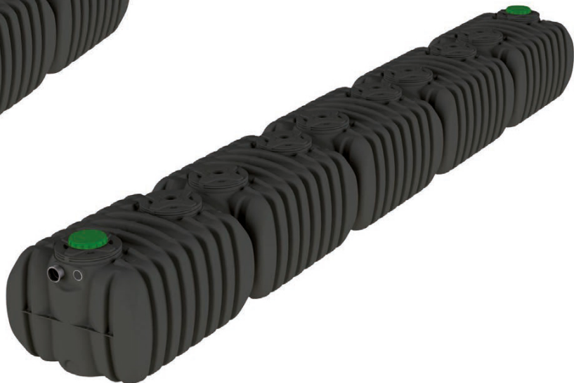
EPURBLOC 185 25000