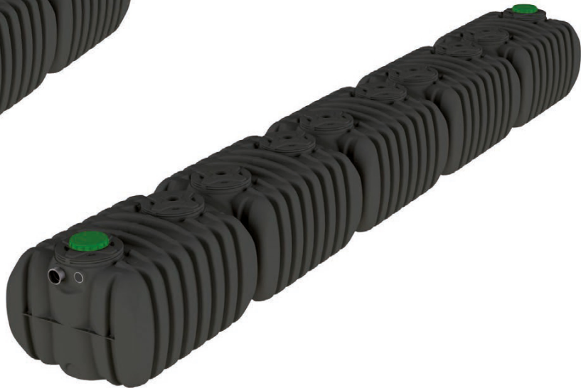
EPURBLOC 185 25000