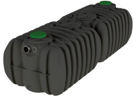
EPURBLOC 185 10000