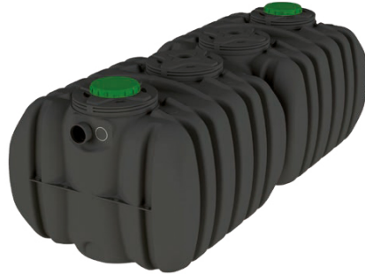
EPURBLOC 185 8000