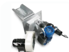
Queimador Osaka Plus [Acendimento Automático]